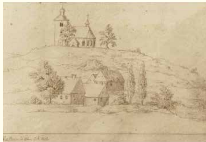
Bleistiftzeichnung der Alten Kirche und Warsteins 1839

cke und Hirschberg auf der Höhe des neuangelegten Stadtberges die Pfarrkirche der Stadt in den Formen der ausgehenden Romanik und beginnenden Frühgotik - mit deshalb heute noch festzustellenden romanischen und gotischen Formdetails. Der Kirchturm mit seinen 3,50 m dicken Mauern war gleichzeitig Wehrturm und letzte Zuflucht für die mittelalterliche Bürgerschaft. Mehrmals wurde mit der Stadt auch diese Kirche von Feuers- und Kriegsgefahren heimgesucht; ein großer Teil der heutigen barocken Ausstattung geht auf die unmittelbare Zeit