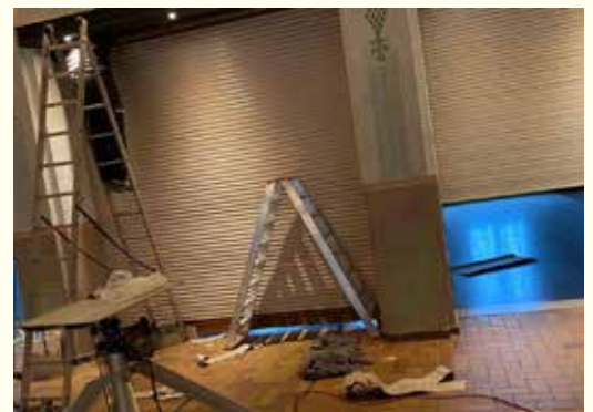
Viele Stunden Eigenleistung...

Brandschutzgründen mussten die drei technisch mangelhaften Türanlagen im Eingangs-/Zugangsbereich des kleinen Saales, konkret die doppelflügelige Durchgangstür, die doppelflügelige Verbindungstür und die einflügelige Verbindungstür zum Thekenbereich ausgetauscht werden. Diese drei Türen in entsprechender Qualität waren zwingend notwendig zur Sicherstellung/Herstellung getrennter Brandabschnitte incl. Fluchtwegsicherung zur Aufrechterhaltung der Betriebserlaubnis. Eine entsprechende Ertüchtigung war in dem Rahmen