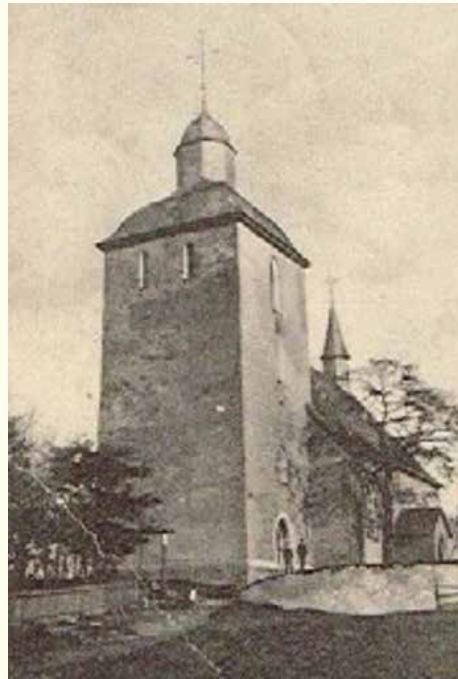
Alte Kirche um 1910