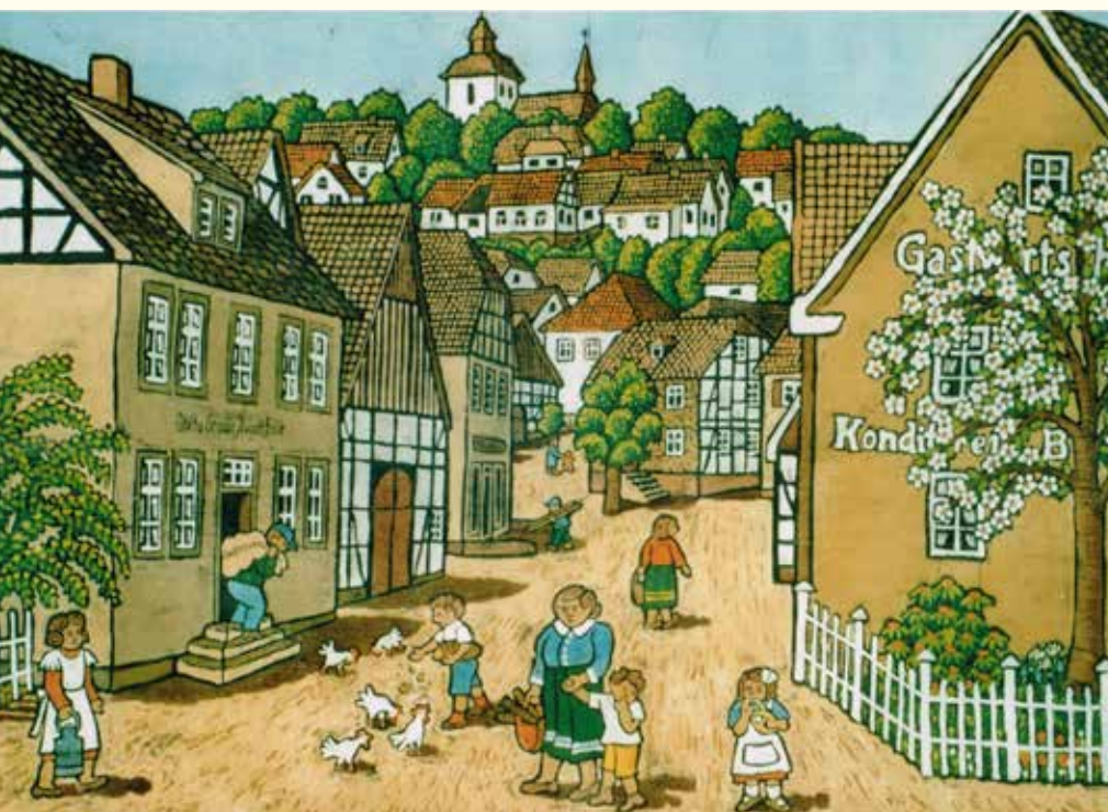
„Auf'm Bruch“ von Angelika Wittkötter-Vonnegot

Einen weiteren markanten Einschnitt stellt die unmittelbare Nachkriegszeit des Ersten Weltkriegs dar. Die Überlegungen zu einer angemessenen „Kriegerehrung“ für die gefallenen Soldaten des Ersten Weltkrieges führten 1922 im Rahmen einer erneuten Restaurierung auch zur Er-